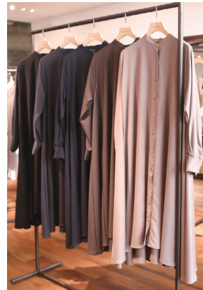
バンドカラーフレアシャツワンピース各 20,900円(税込)