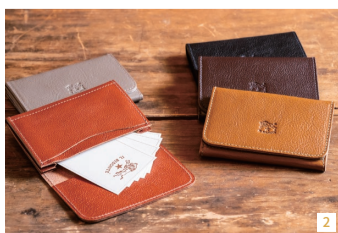
1.イルビゾンテのトートバッグ各84,700円 2.イルビゾンテのカードケース各13,750円 3.洗練されたデザインの革製品が充実している