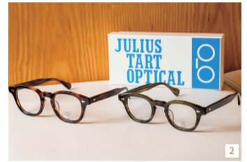
1.奥からモスコットのレムトッシュ49,500円、ジャパンリミテッド19 51,700円 2.ジュリアスタート オプティカルAR 各51,700円 3.機能性とファッション性を兼ね備えた国内外のブランドを扱う

眼鏡はその人の印象を大きく左右するファッションアイテム。ポーカーフェイスはスタンダードから最新モデルまでさまざまなデザインのアイウェアが並ぶショップだ。豊富な知識を持つスタッフが顔の形、髪型や肌の印象に合わせて商品を提案してくれる。スタッフの筒井泰孝さんのお勧めは、100年以上の歴史を持つニューヨークのブランド、モスコットのフレームだ。「日本人の鼻筋にフィットするように設計された限定モデルは、表情に知的な雰囲気を加えてくれます。また、古き良き時代のアメリカンスタイルを継承するジュリアスタート オプティカルフレームもお試ください」。春から初夏はクラシックな着こなしに合うカーキやブラウンが人気のカラーだ。