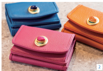
1.左からタグ・ホイヤーのカレラ ジャパンリミテッド エディション41mm 781,000円、36mm 621,500円 2.日本人デザイナーが手がける小物ブランド、ハシバミのミニウォレット各13,200円 3.ギフトにもぴったりのアイテムが充実している