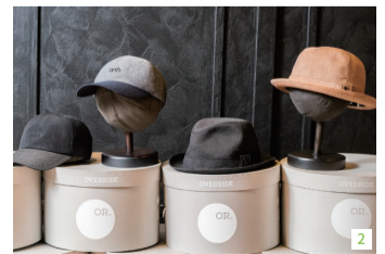
1.左からシャポードオーのブルン各12,100円、ハット各12,100円 2.左からアースのキャップ各14,300円、ハット各16,500円 3.不要になった帽子を回収、再利用するサステナブルなサービスを実施している

オーバーライドは国内外から厳選したブランドやオリジナルブランドを展開する帽子の専門店。春から初夏のコーディネートに活躍する帽子が充実している。「和紙を使った通気性のいいハットに注目してください」と店長の清野和雄さん。大人の女性をターゲットにするブランド、シャポードオーのハットは、クラシックかつモダンなデザインが特徴。前つばが上向きに反り返ったプリム型は、顔周りを明るく見せ、着こなしをエレガントな印象にしてくれる。男性にはウールの上品さとリネンの清涼感を兼ね備えたキャップとハットがお勧めだ。「清潔感や大人っぽさを大切にしたカジュアルなコーディネートに合わせてみてください」