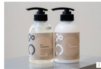
1.髪質改善ストレートエステ+4ステップトリートメント+カット12,800円、髪質改善ストレートエステ+カラー+4ステップトリートメント+カット16,800円(土・日曜、祝日は+7%料金) 2.&Cのシャンプー・トリートメント各2,480円 3.トレンドを取り入れた理想のスタイルを叶えてくれると評判だ

クロエ バイ ラヴィズムは、美容やファッションに感度の高い世代に支持されているヘアサロン。湿気による髪広がりが気になる季節を前に、髪質改善ストレートエステに注目だ。クセを伸ばしながら髪の潤いを保つ新しい施術で、縮毛矯正よりも髪への負担が少ないのが特長。髪を内側から補修することで、本来の艶を引き出す。トリートメント配合カラーを併用すれば、色持ちと発色が格段に良くなる。また、自宅でのケアにはオリジナルブランド「&C」のシャンプーとトリートメントがお勧めだ。シャンプーは低刺激で優しい洗い心地。トリートメントは熱を利用してダメージを補修する効果があり、滑らかな指通りの髪を維持してくれる。