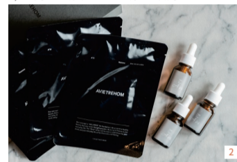
1.ビューティーフットケア(足の爪まわりのお手入れ+角質ケア)12,800円、角質ケア7,000円(タコ・ウオノメ取りは別途1,200円から) 2.左からアヴィエトラオムフェイスパック 21枚入5,500円、アヴィハンド&ネイルオイル 2,860円 3.清潔感のある明るい店内

サンダルを履く機会が増えるこれからの季節に向けて準備しておきたい足のケア。「爪の健康と美しさ」をテーマに掲げるネイルサロン、ネイル デコ バイ アヴィのスタッフ、小柳愛子さんに注目のメニューを聞いた。「足裏など見えない部分を整えると、素足に自信が持てるようになります。自宅でのケアが難しい魚の目やタコ、蓄積した古い角質を取り除くフットケアメニューがお勧めです」。豊富な知識を持つスタッフの施術は心地よく、滑らかでふっくらとした質感になる。また、店内ではオリジナルブランドのホームケアグッズも販売。1枚でスキンケアができる男性向けオールインワンパックや、ハンド&ネイルオイルなどのアイテムがそろそろ。