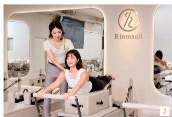
1.アイボリーを基調とした23台のマシンが並ぶ上質な空間 2.大型スクリーンとインストラクターのサポートで行うグループレッスン 3.仕事帰りや買い物のついでに気軽に立ち寄れる、アクセス抜群の立地

リントスルは「凛とした毎日は姿勢から。」をコンセプトにする女性専用のマシンピラティススタジオ。アイボリーを基調とした清潔感あふれる店内には23台のマシンが並び、上質な空間で自分磨きに集中できる。メインのレッスンは、専用マシンのリフォーマーを用いたエクササイズだ。所要時間は、1回30分または50分の2コース。大画面スクリーンと女性インストラクターの丁寧なサポートにより、運動初心者でも正しく体幹を鍛え、美しい姿勢の維持を目指すことができる。現在、リフォーマーを使う体験やパーソナル姿勢診断を受けられる無料体験会を実施している。仕事帰りや買い物の合間に通って、理想のボディラインを手に入れよう。